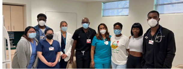
El personal de CHI y el paciente posan para una foto después de la visita del grupo de diabéticos.

“Quisiera que sus comidas tengan carbohidratos complejos, por ejemplo, una batata o frijoles negros. Estos carbohidratos