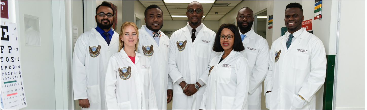
El nuevo grupo de residentes médicos de CHI contribuye a la calidad total de la atención médica dentro de la organización.

Community Health of South Florida, Inc. (CHI) es reconocido como un “Centro médico líder en calidad” por el Departamento de Salud y Servicios Humanos de EE. UU. (U.S. Department of Health and Human Services, HRSA). CHI recibió un premio por estar dentro del 20 por ciento de centros médicos a nivel nacional que aplican medidas clínicas de calidad.