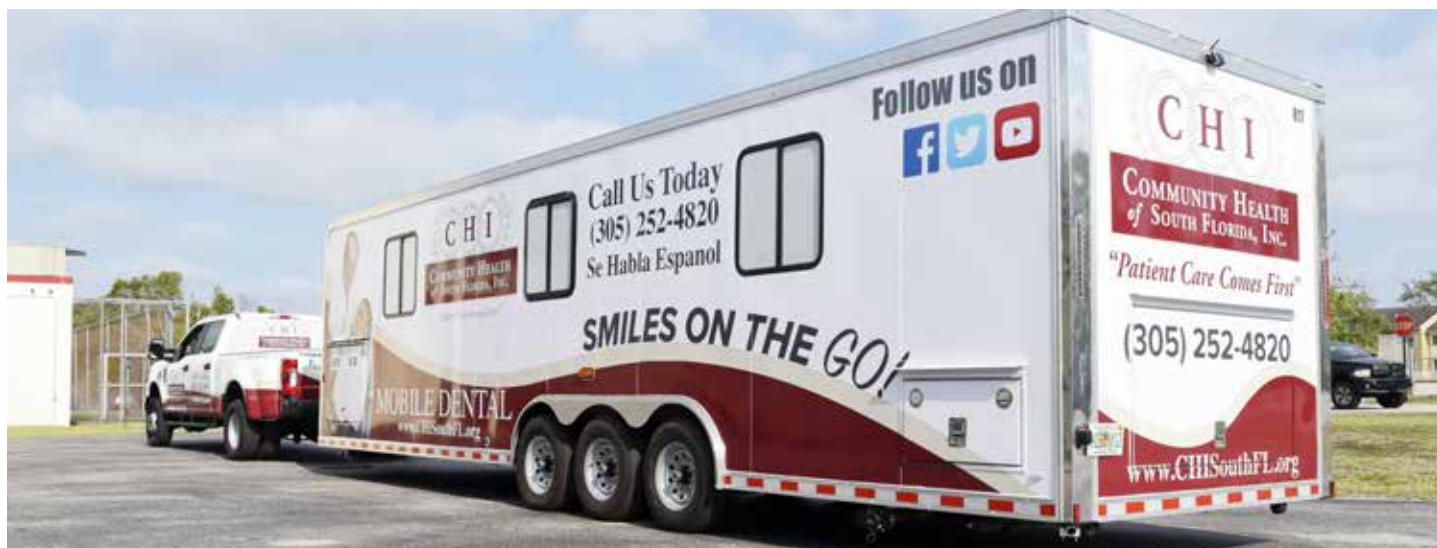
CHI reparte sonrisas sobre ruedas con su unidad móvil dental. La unidad visita escuelas y campamentos de verano para dar atención dental a los niños.

Cuando el remolque dental móvil de Community Health of South Florida, Inc. (CHI) llega a una escuela o a un campamento de verano, el resultado final es una bella sonrisa para los niños. Recientemente, CHI recibió un subsidio de casi $180,000 del Children's Trust para dar atención dental preventiva a aproximadamente 1,800 estudiantes entre las edades de 3 a 13 años.