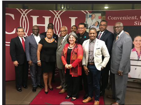
El liderazgo de CHI, los líderes políticos y religiosos posan juntos después de la cena de reconocimiento a los líderes religiosos.

Cuando se reunieron docenas de líderes religiosos en el centro Médico Doris Ison (Doris Ison Health Center), había una sensación de paz en el salón. Algunos tenían conocimiento de los centros médicos calificados a nivel federal,