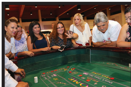
Los miembros de la Junta Directiva de CHI y miembros de la comunidad se divierten jugando a los dados en la Noche de Casino.

Noche de Casino auspiciada por la Fundación Community Health of South Florida, Inc. La recaudación de fondos produjo casi $30,000 para ayudar a CHI a construir un centro de crisis para niños.