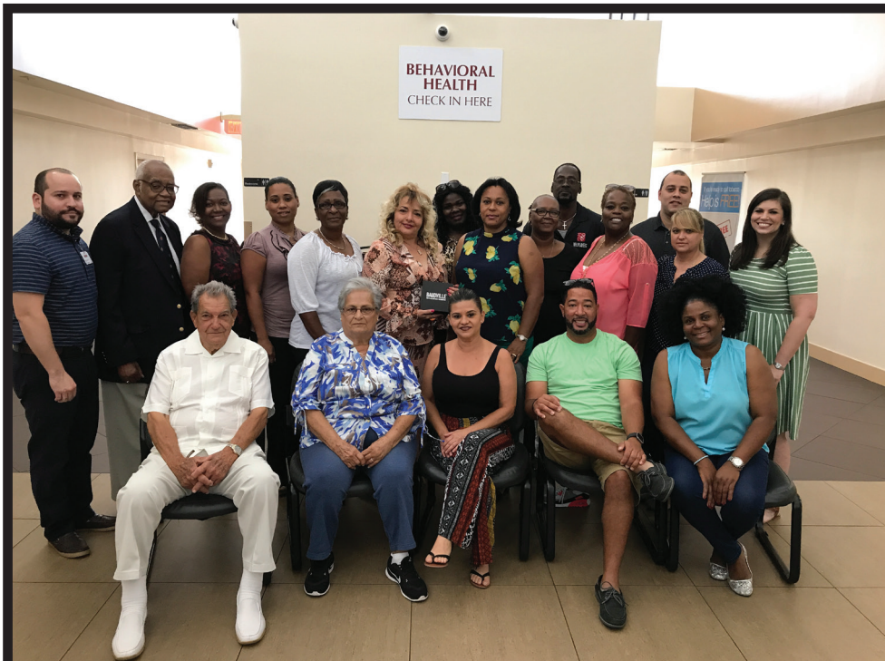
Los padres de acogida, el personal y los socios comunitarios de CHI se toman una foto después del desayuno-almuerzo en honor de los hogares sustitutos.